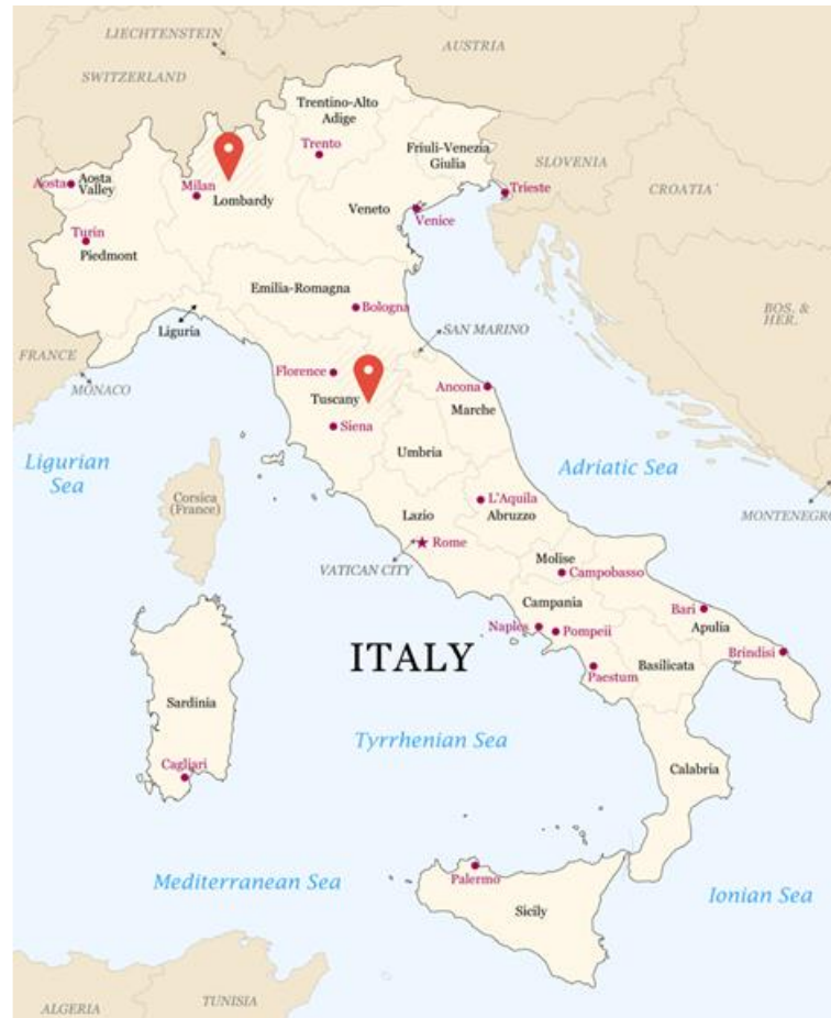
Figura 1: Ubicazione dei siti produttivi della CA